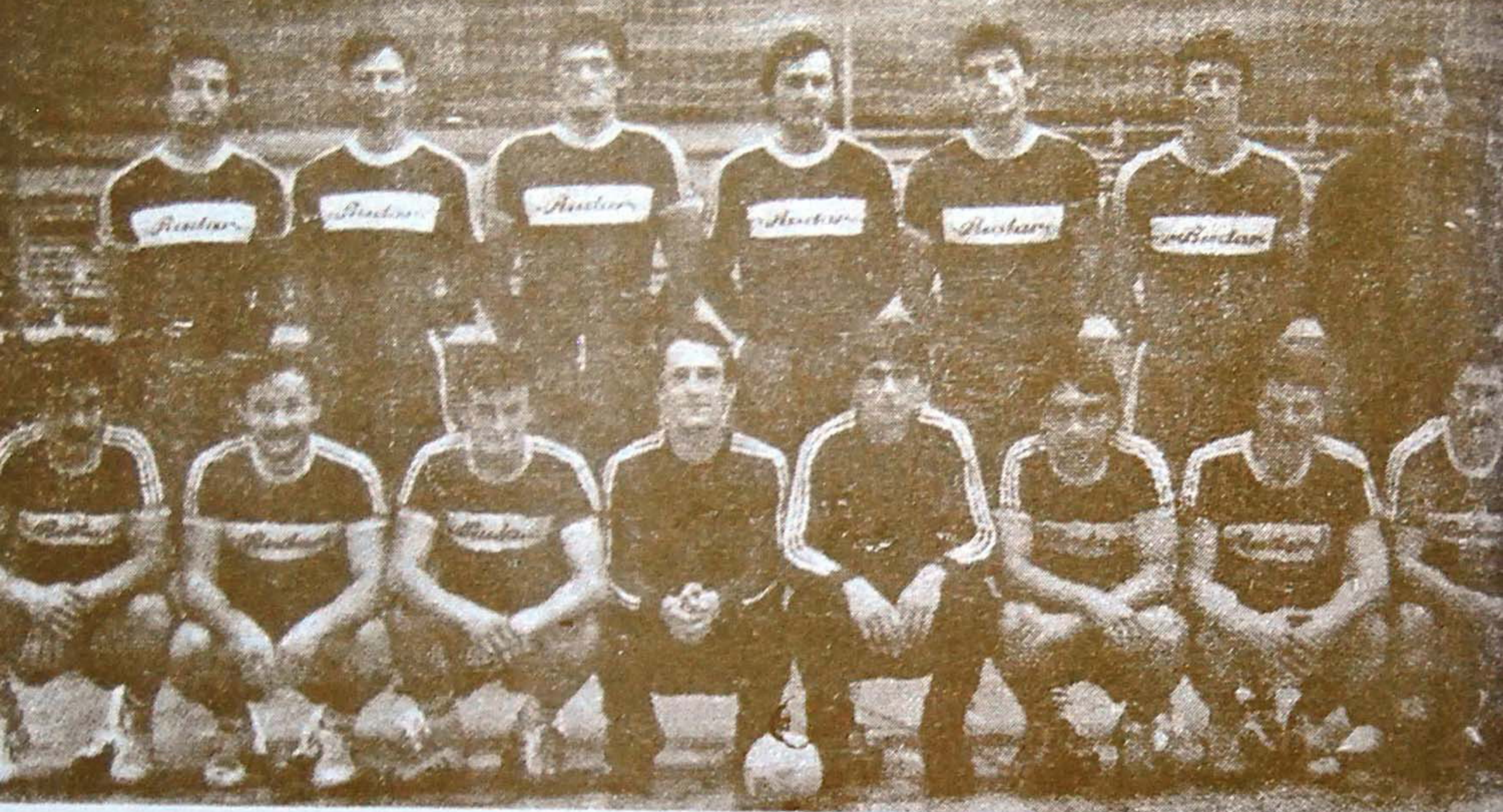
Snimak sa poslednjeg učešća na Turniru