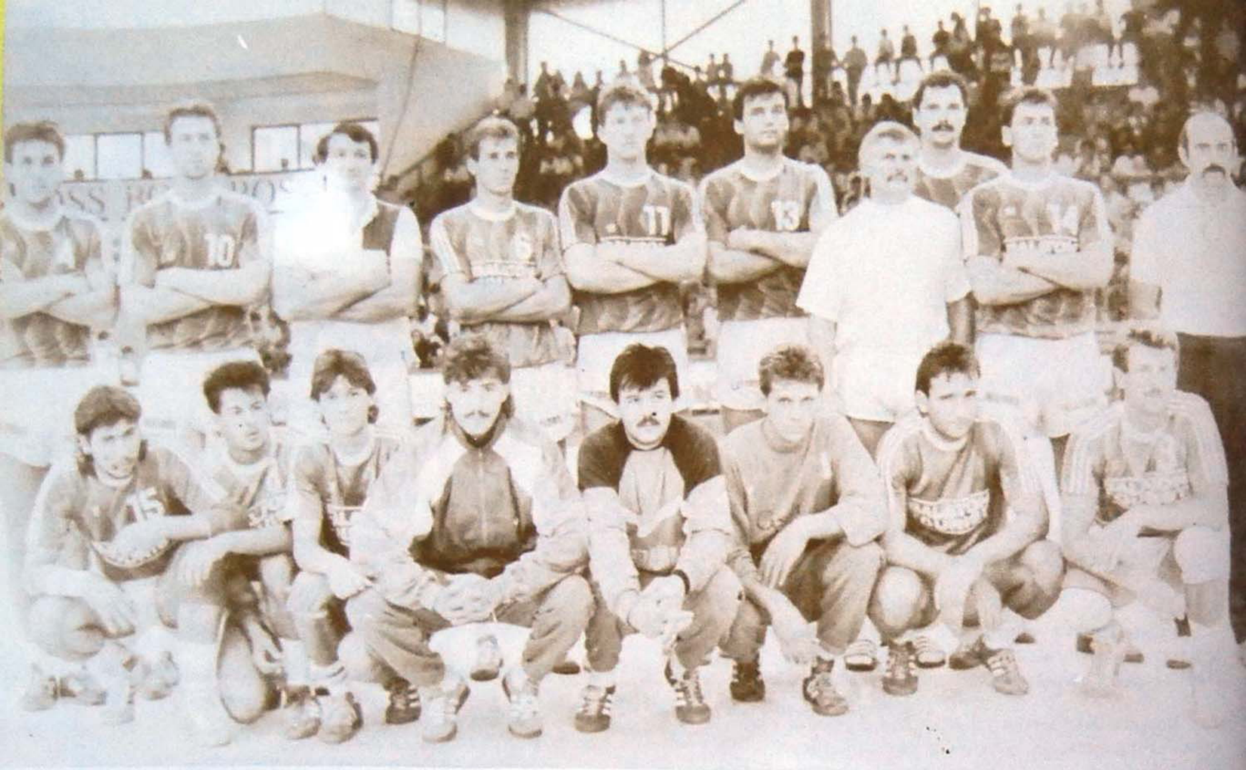
POBJEDNIK TURNIRA BRAMAK Vesprem